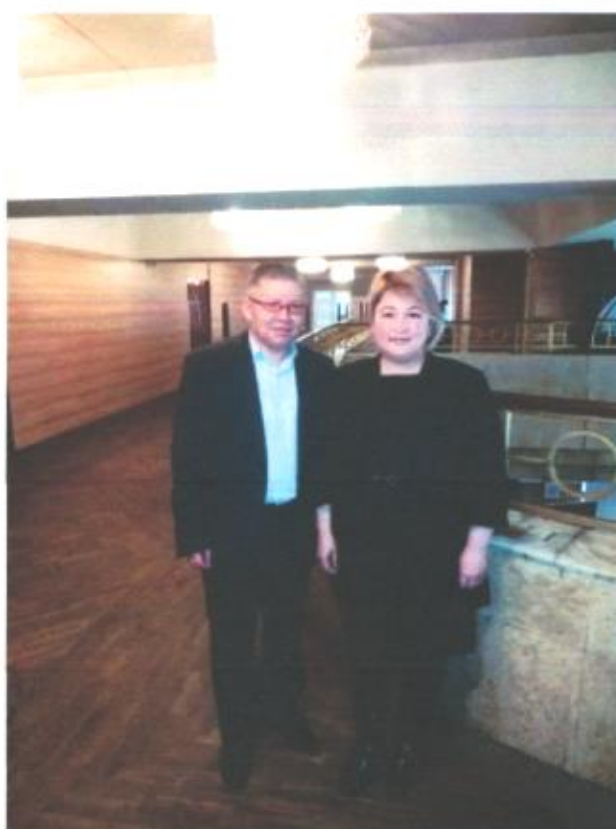
Курсы повышения квалификации дата выдачи сертификата 15.08.18г.